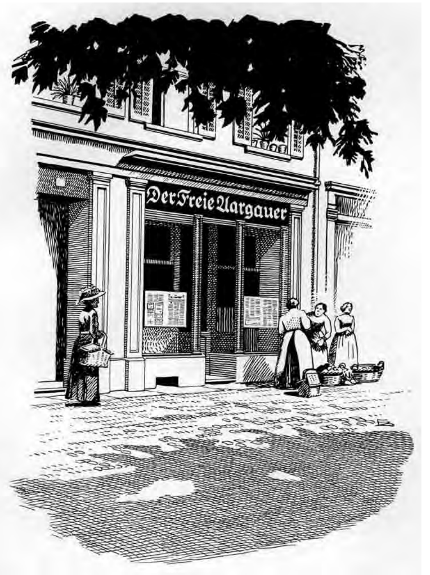
Bei seiner Gründung 1906 wurde der „Freie Aargauer“ in diesem Haus am Graben in Aarau gedruckt.